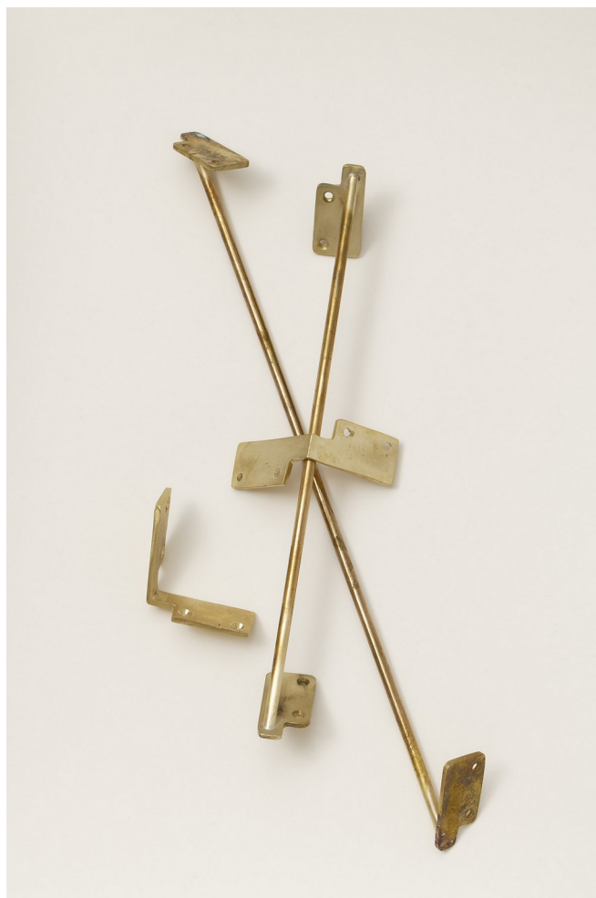
V.2, Système d'équerre en fonte, 2022 réalisées pour Ker Xavier.