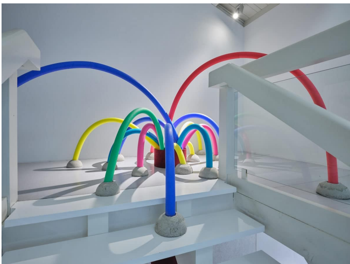
Paradis perdus , installation, colonnes en velours, divers objets, dimensions variables.

La Ferme de la Chapelle, Grand-Lancy (Suisse), 2022.