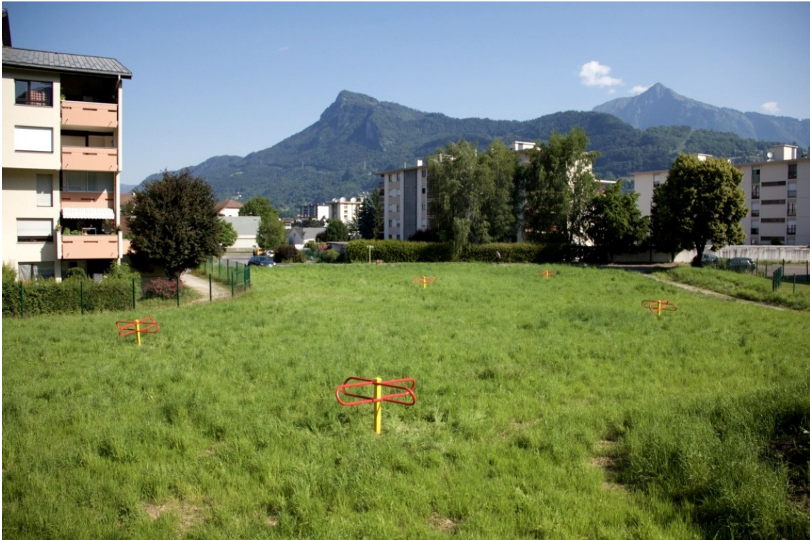
Éole , sculpture, tourniquets mécaniques, peinture. 100x180x180 cm. Cluses, 2016.