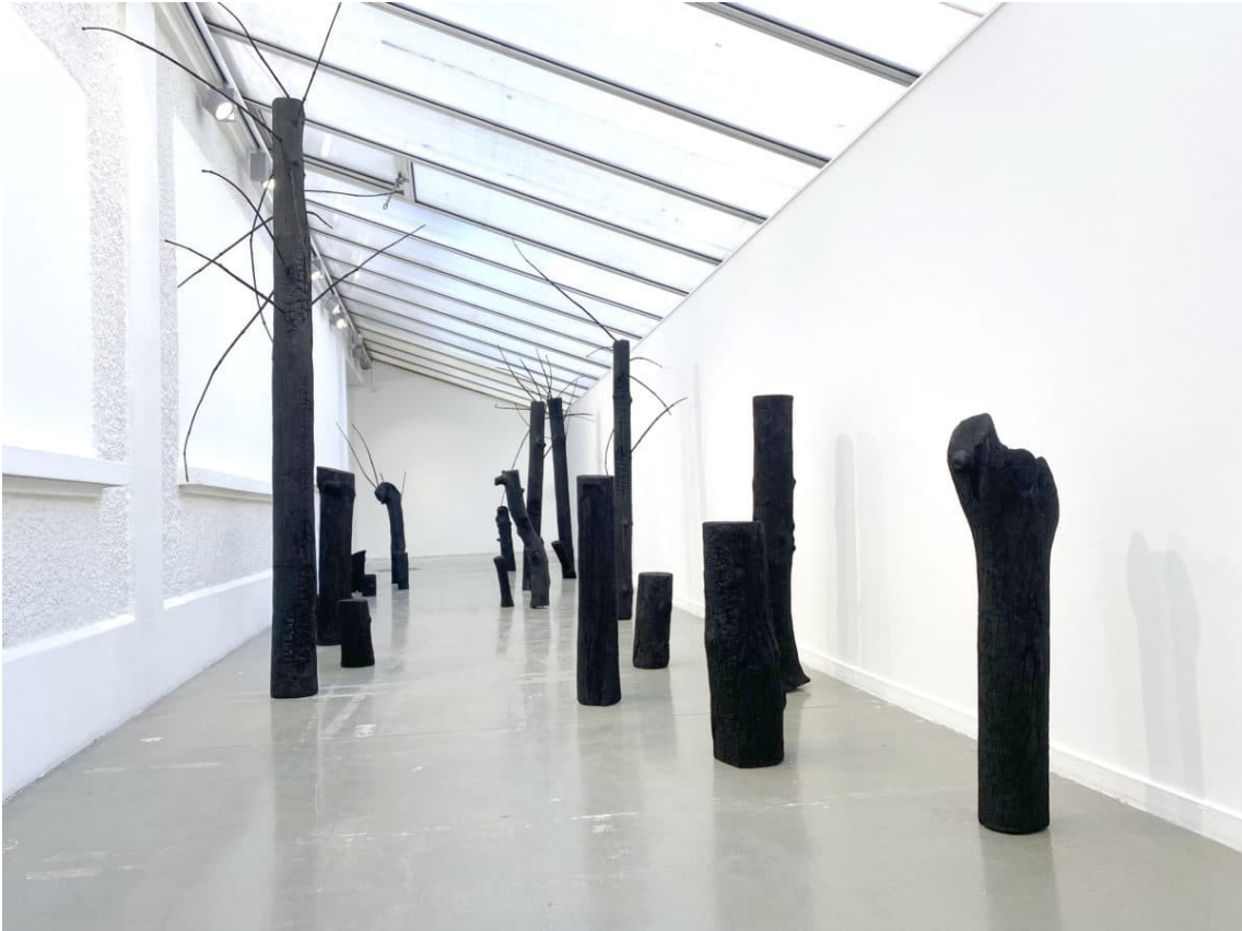
Palo Santo , installation, 21 troncs d'arbre brûlés, branches brûlées, huile de tung. 10×3,5×3 m. Vue de l'exposition Forces invisibles , L'Angle, la Roche sur Foron, 2025.